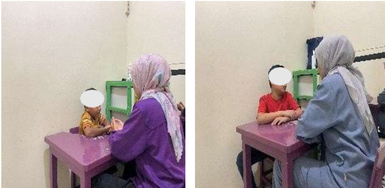
Gambar 2. Pelaksanaan Terapi Wicara

Tindakan yang dilakukan oleh terapis mencerminkan strategi adaptif dalam menjaga keterlibatan anak selama proses terapi. Terapis menunjukkan adaptasi terhadap lingkungan fisik agar anak tetap nyaman dan fokus selama terapi.