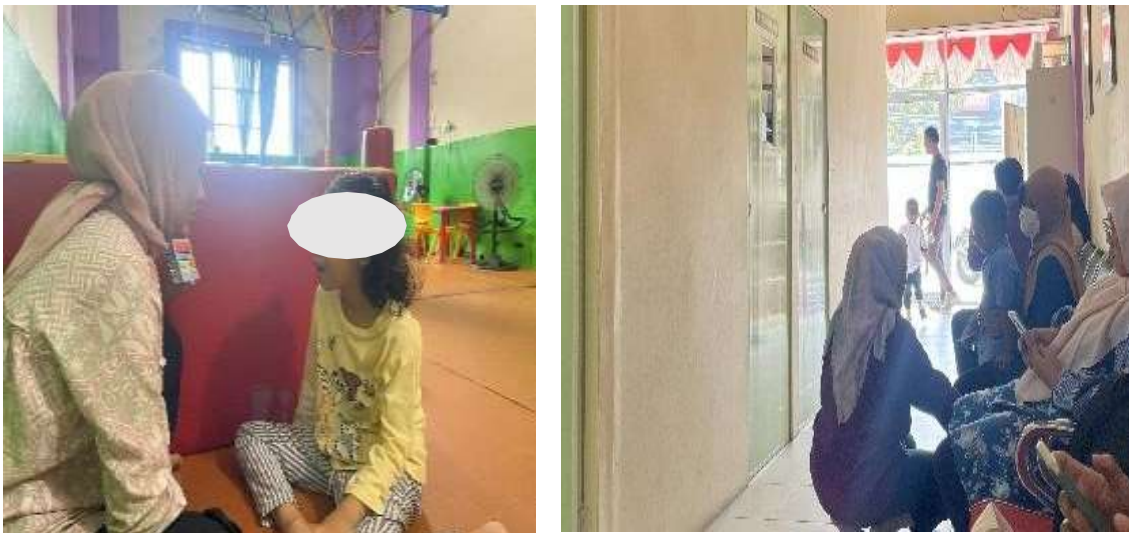
Gambar 3. Komunikasi Terapis Kepada Orang Tua

Terapis memberikan hasil perkembangan terapi melalui buku komunikasi terapi dan kemudian terapis juga menjelaskan kembali hasil terapi secara langsung kepada orang tua, serta memberikan laporan dalam bentuk lampiran surat mengenai perkembangan hasil terapi anak 1 kali dalam 3 bulan. Manager operasional juga menyatakan bahwa orang tua terlibat dalam proses terapi. Karena orang tua memiliki peran penting dengan memiliki kerjasama yang baik, komunikasi yang baik, kemudian penerapan program yang baik yang disampaikan oleh terapis kepada orang tua sehingga proses atau perkembangan anak menuju ke arah yang lebih baik menjadi lebih optimal. Dengan terapis menjalin hubungan yang baik dengan orang tua serta membangun interaksi sosial anak dengan teman sebaya, menggambarkan sebagai bentuk adaptasi sosial yang mendukung keberlanjutan kerja dan proses terapi.